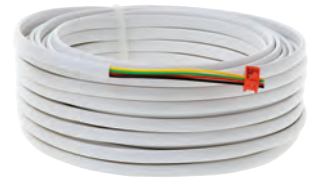
FERNBEDIENUNG AUTOMIX 10 RC